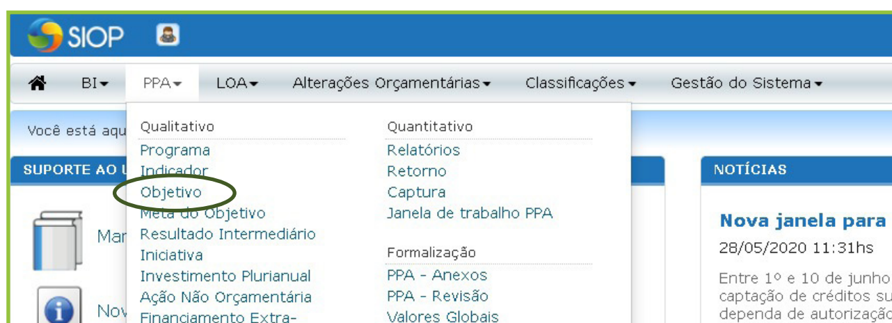
Figura 1: Acesso aos Objetivos

Os Resultados Intermediários ficarão ligados ao Objetivo do Programa. Para registrar um novo Resultados Intermediário, você deve acessar PPA – Qualitativo – Objetivo (Figura 1).