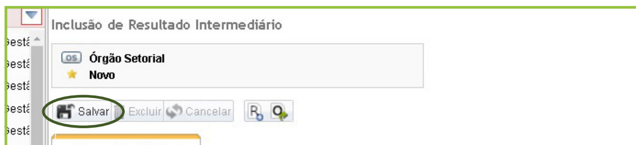
Figura 5: Botão salvar Resultado Intermediário

Preenchidos os campos, clique em "Salvar", no canto superior esquerdo.